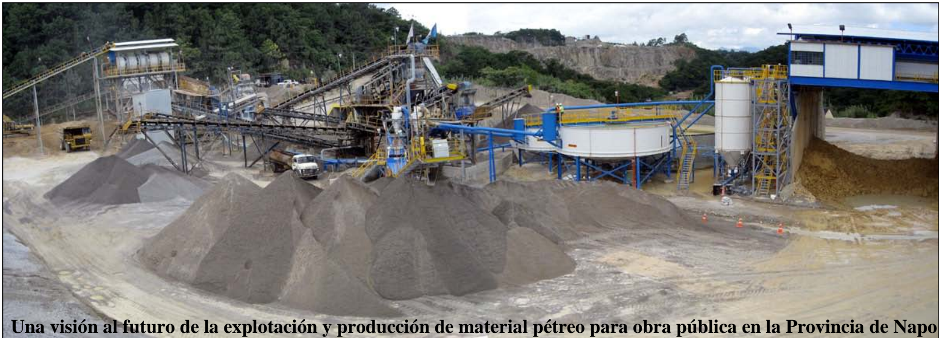
Una visión al futuro de la explotación y producción de material pétreo para obra pública en la Provincia de Napo